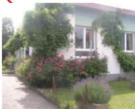
Antenne de l'IMP à WISSEMBOURG