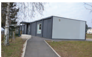
L'IMP à HAGUENAU