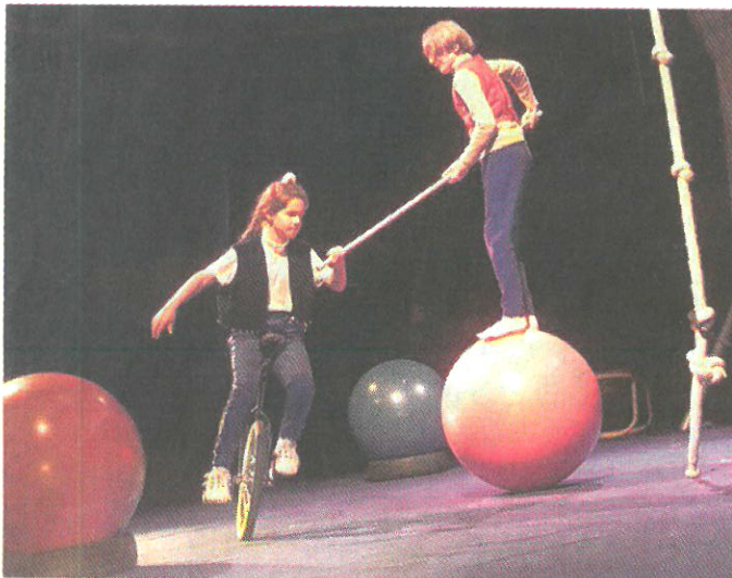
Deux spectacles inédits seront proposés ce samedi dès 18h au jardin des Deux-Rives.

Graine de cirque invite petits et grands à fêter la fin de l'année scolaire ce samedi 9 juin, dès 18 h au jardin des Deux-Rives à Strasbourg. L'occasion de découvrir deux spectacles inédits. La première représentation, « Formes de Cirque » proposera un spectacle d'improvisation qui mêle le mouvement corporel à celui de l'objet. Au cœur de la prestation, les lignes, les courbes et les actions qui découlent de tous ces mouvements. En deuxième partie de soirée, dès 20 h 30, le cabaret « Circ'Envol » offrira un florilège de numéros d'arts du cirque.